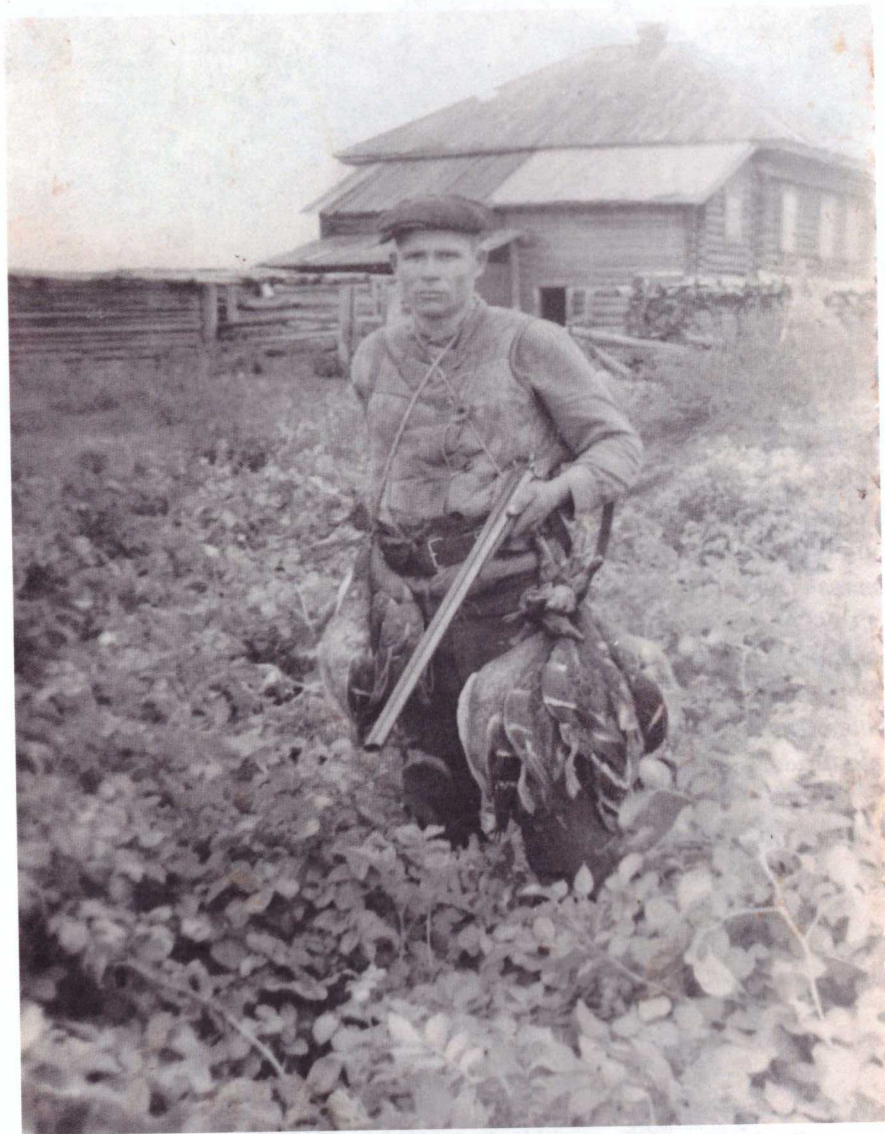
После удачной охоты