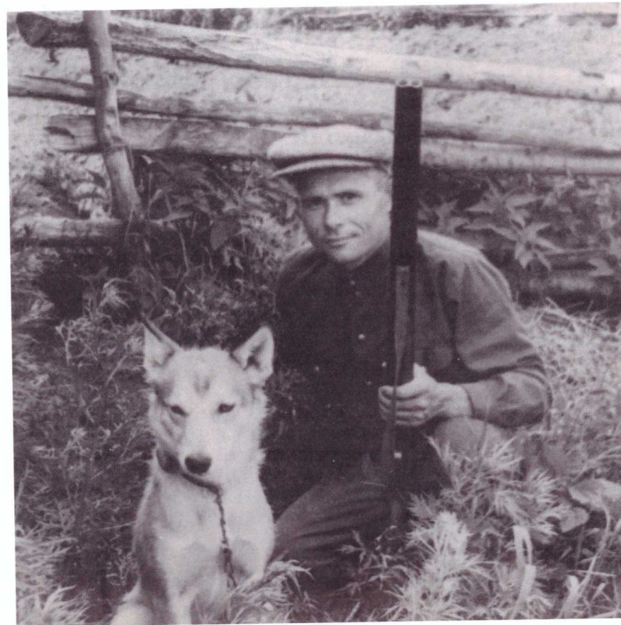
С любимой собакой