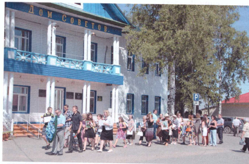
22 июня 2016 г. Акция «За того парня»

Минуло 73 года с того времени, как фашистская Германия вероломно напала на Советский Союз. Однако на фоне нынешних событий на Украине боль и тревога, оставшиеся в сердцах поколения Великой Отечественной войны и их потомков, вспыхнули с новой силой. Война – это страшная вещь, война – это боль, слёзы, кровь и смерть.