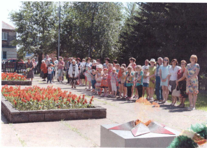
Участники митинга – взрослые и дети